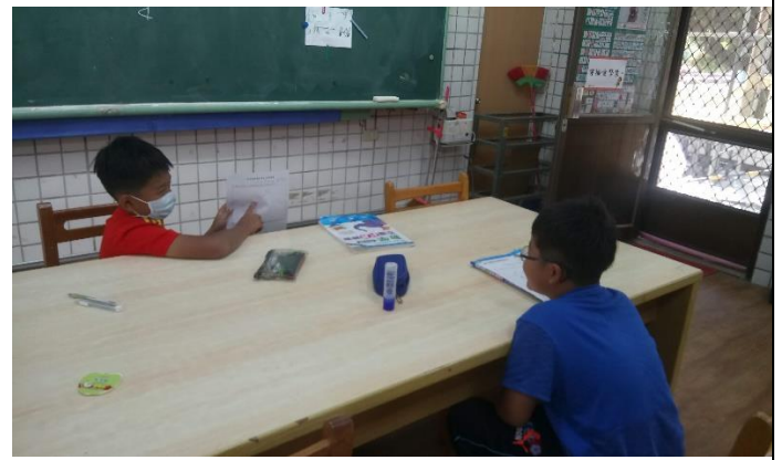
相片說明：相互分享學習單內容