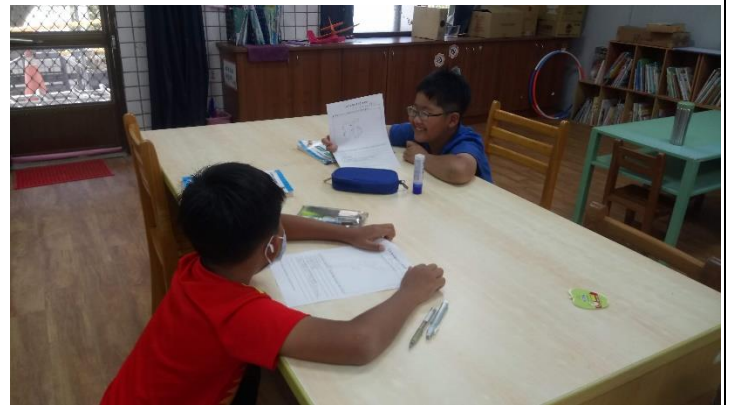
相片說明：互相分享學習單內容