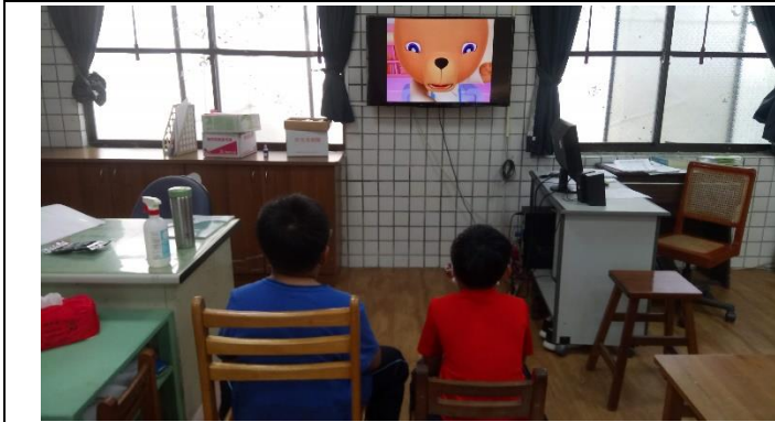
相片說明：觀賞閩小妹「防止家庭暴力」