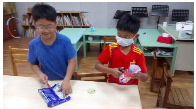
相片說明：收集零食飲料包裝袋的營養標示