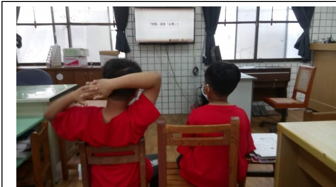
相片說明：觀賞影片了解「想要、需要」的差別