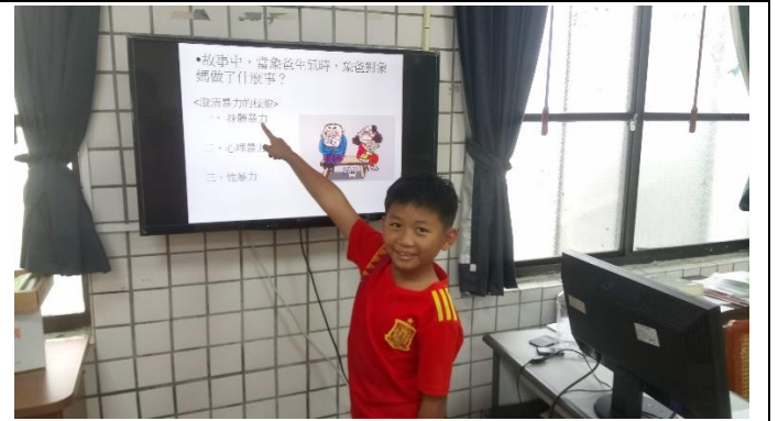
相片說明： 回答繪本內容並分享心得