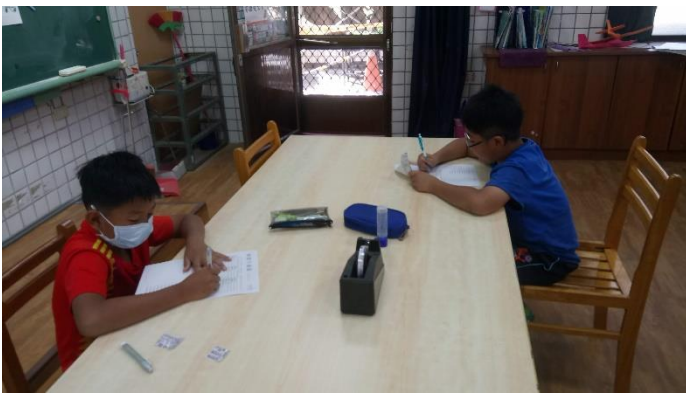
相片說明：分析營養標示內容。