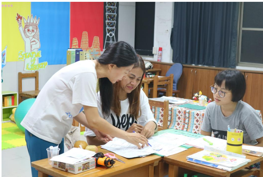
說明：護理師與家長說明學童成長狀況及注意事項。